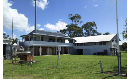
↑ (ブラウンシー水上活動センター)

大阪出発：3月22日 夕刻・関西国際空港出発 3月23日 午後・ブリスベン国際空港到着 帰国：4月1日 早朝・ブリスベン国際空港出発 同日 夕刻・関西国際空港到着 詳細は以下の通りである。