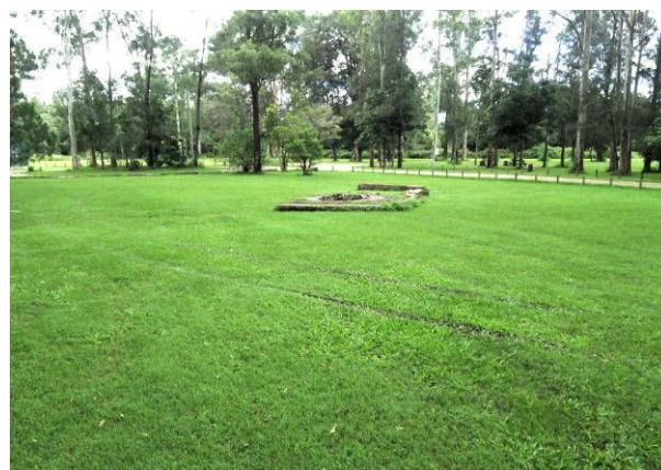
BPパークキャンプ場のファイアベース