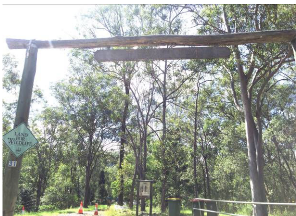
タイムラムキャンプ場のゲート